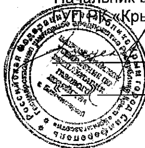
График доставки сжиженного газа населению Бахчисарайского района

Понедельник: с. Соколинное, с.Аромат, с.Куйбышево, с.Голубинка, с.Танковое, с.Малое Садовое, с.Большое Садовое, с.Солнечноселье, с.Поляна, с.Путиловка